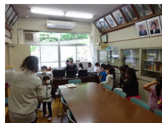
1年生校長室見学中！

学校が再開し、1年生はいよいよ校内探検を実施しました。校内の各教室を見て回りました。大きなお兄さんやお姉さんが頑張って勉強している姿や、特別教室の設備を見て回りました。校長室や職員室も楽しく探検しました。